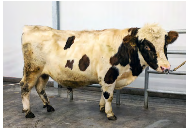
Jarfi 16016 frá Helgavatni.

Skírnir 16018 , f. Gustur 09003, mf. Sírius 02032. Skírnir lækkaði um fjögur stig og verður ekki áfram í hópi nautsfeðra. Hann er eftir sem