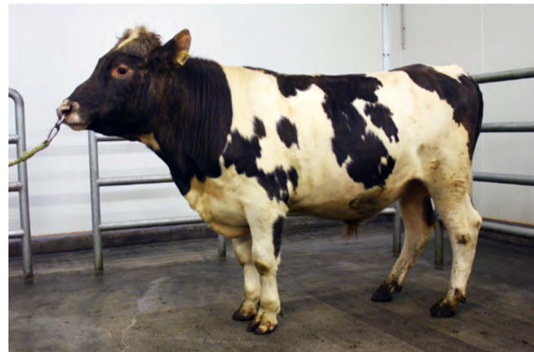
Tanni 15065 frá Tannstaðabakka.

áður með gott mat enda eru dætur hans efnahár, með góða jógurgerð, mjaltir og skap. Heildareinkunn 107.