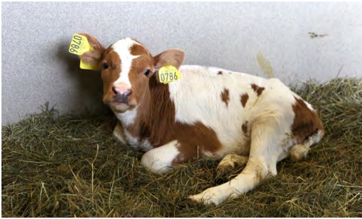
Ef horft er til afdrifa fæddra kálfa þá voru 64,8% nautkálfa settir á til lífs.

Kynhlutfall fæddra kálfa var eins og fyrr skekkt en áþekkt og verið hefur. Nautkálfar voru 53,2% fæddra kálfa samanborið við 53,1% árið áður. Ef horft er til afdrifa fæddra kálfa þá voru 64,8% nautkálfa settir á til lífs. Þetta hlutfall er ívið lægra en árið þegar hlutfallið var 66,2%. Hlutfall þeirra nautkálfa sem slátrað er nýfæddum hækkar eilítið milli ára, eða í 14,5% úr 14,0%. Samdráttur í ásetningu nautkálfa á sér án efa skýringu í slakri afkomu nautakjötsframleiðslunnar. Af nautkálfunum fæðast 17,3% dauðir eða farast í fæðingu og 2,7% þeirra drepast innan 20 daga frá fæðingu.