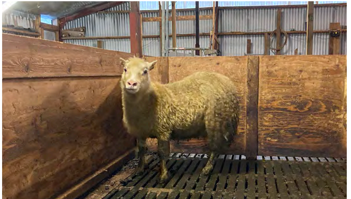
Gullbrá 16-189 frá Víflsdal býr yfir hinni fágætu ARR genasamsætu.

Gullbrá er kollótt og hreinhvít að lit. Faðir hennar er Baggi 12-441 sem var kauphrútur frá Ragnari og Sigríði á Heydalsá. Faðir Bagga, Strengur 09-891, og móðurfaðir, Bogi 04-814, eru þekktir sæðingastöðvahrútar sem vitað er að ekki báru ARR. Baggi er ógreindur og á ekki fleiri lifandi afkvæmi en Gullbrá. Hins vegar eru til afkomendur hans. Frekari