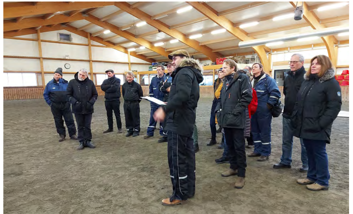
Dómarar á samræmingarnámskeiði í mars 2022.