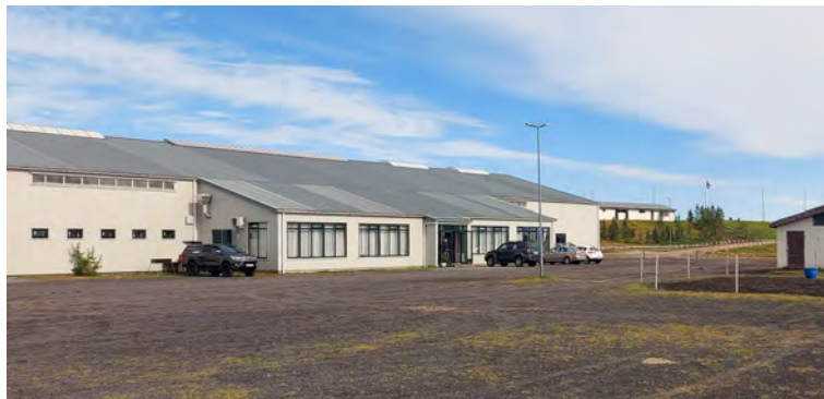
Gaddstaðaflatir við Hella.

RML áskilur sér rétt til að fækka dögum á sýningum ef skráningar eru færri en búist er við og sameina sýningar ef þess gerist þörf. Sýning verður ekki haldin nema lágmarksfjöldi skráninga náist sem eru 30 hross. Hér að neðan má sjá sýningaaætlun vorsins og hvenær eru síðustu skráninga- og greiðsludagar.