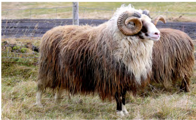
Forystuhrúturinn Frakki 20-895 frá Holti.