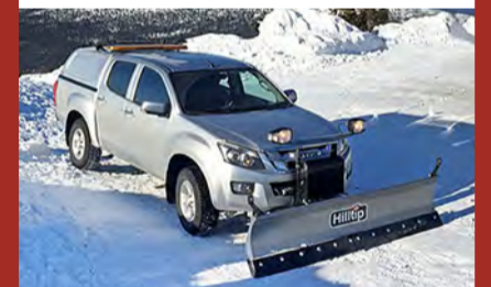
Hilltip Snowstriker SP Snjótonn fyrir pallbíl, minni vörubíla og jeppa. Fáanlegur í 165–240 cm breidd.