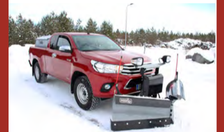
Hilltip Snowstriker VP Fjöplógur fyrir pallbíl, minni vörubíla og jeppa. Fáanlegur í 185–240 cm breidd.