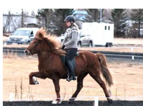
Hnota frá Stuðlum.