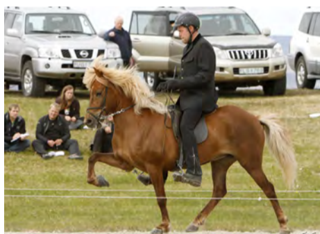
Glæða frá Þjóðólshaga 1.