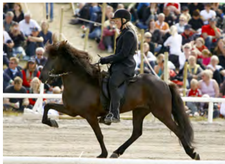
Píla frá Syðra-Garðshorni.