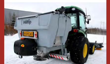
Hilltip Icestriker 600 TR Rafdrifinn kastdreifari fyrir dráttarvélar m/öflugum efnisskömmtunarbúnaði.