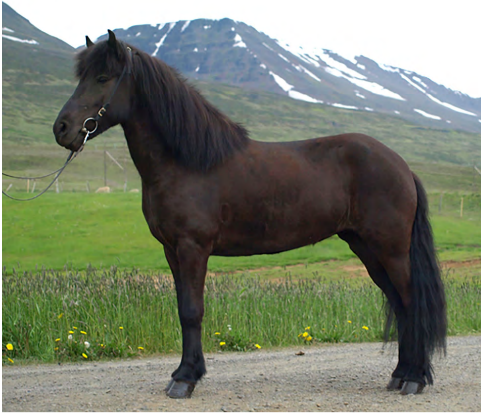
Stilla frá Litlu-Brekku.