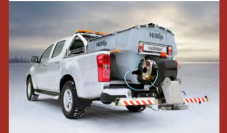
Hilltip Icestriker 380–550L Salt og sanddreifarari í tveim stærðum, fyrir minni pallbíl. Rafdrifinn 12V.