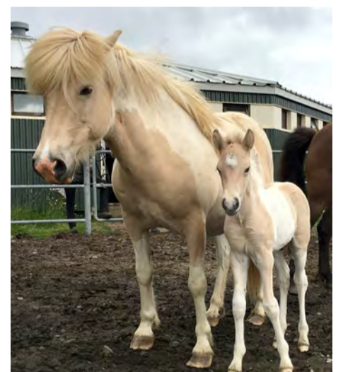
Álfarún frá Halakoti.

Hnota frá Stuðlum gefur framfalleg og myndarleg hross með afar góða fætur. Þau eru ásækin í vilja með fallega framgöngu. Hún hlýtur heiðursverðlaun fyrir afkvæmi og þriðja sætið.