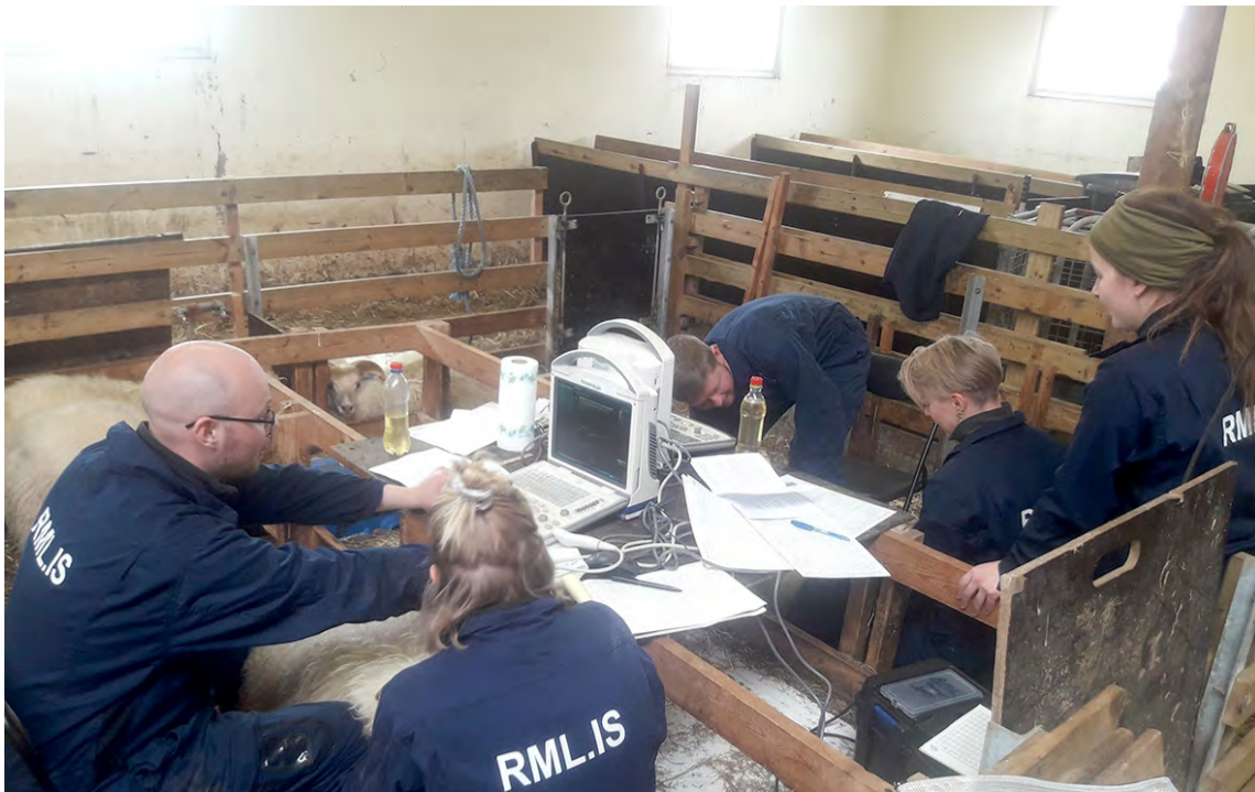
Um þessar mundir fara fram hin árlegu samræminganámskeið fyrir sauðfjárdómara. Eitt af áhersluatriðunum á námskeiðunum er að fylgja eftir uppfærslu á dómstiganum.