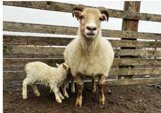
Áhugasöm tvílemba að viðra sig.