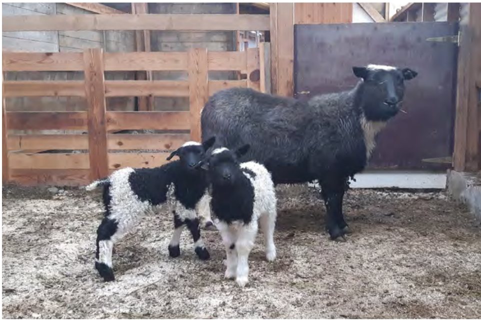
Sælleg og stolt tvílemba sem hefur það ákaflega gott.