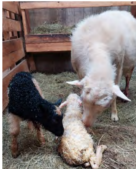
Hreinlæti skiptir sköpum þegar vanda skal til verka á sauðburði.