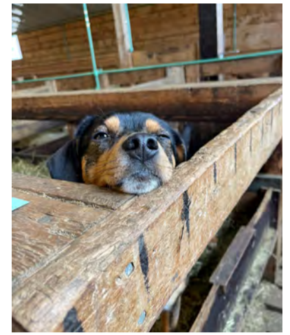
Allir verða aðeins þreyttir á sauðburði og gott getur verið að lygna aðeins aftur augunum.