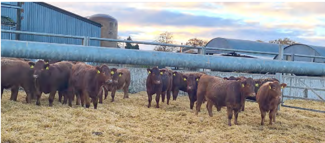
Ungir holdakálfar á eldistímanum.