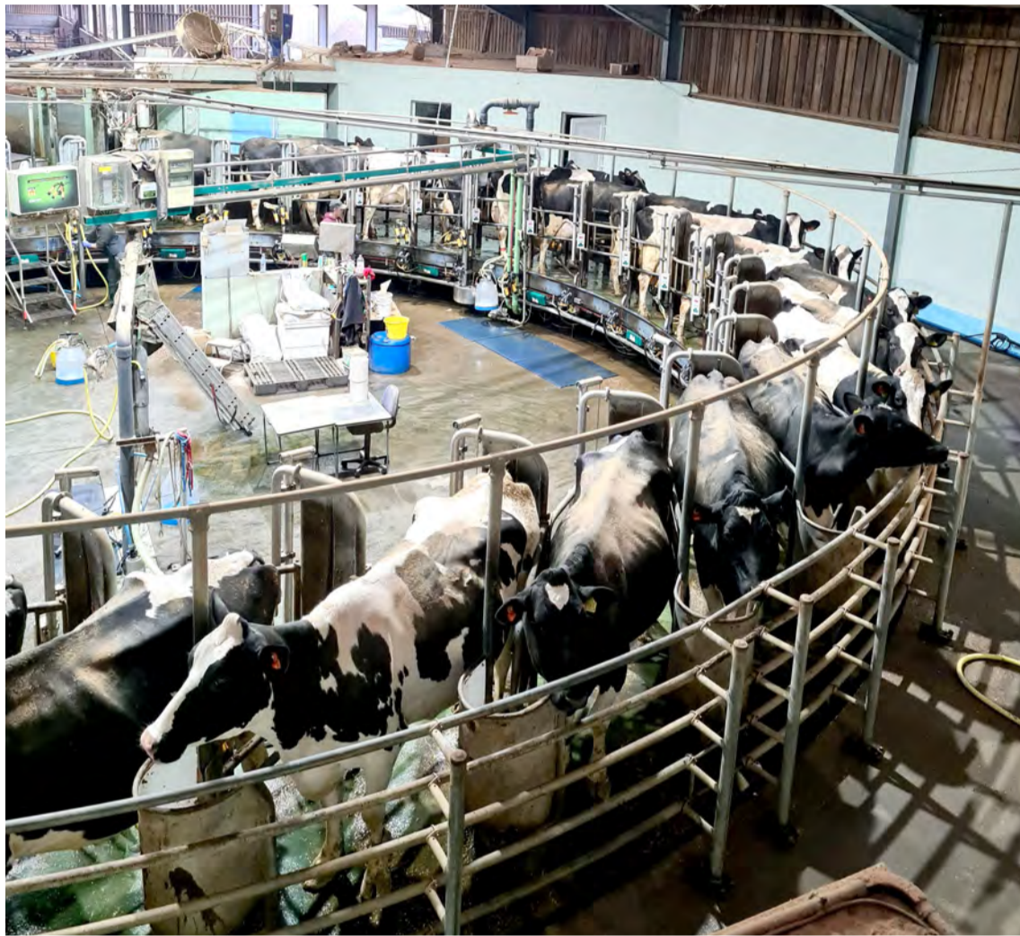
Mjaltir í hringekju fyrir 36 kúr.

Á búinu er mikil áhersla lögð á einsleitni fóðurs, samloðun og fóðurgæði til hámarksafurða. Heilfóðrið var að mestu samsett úr