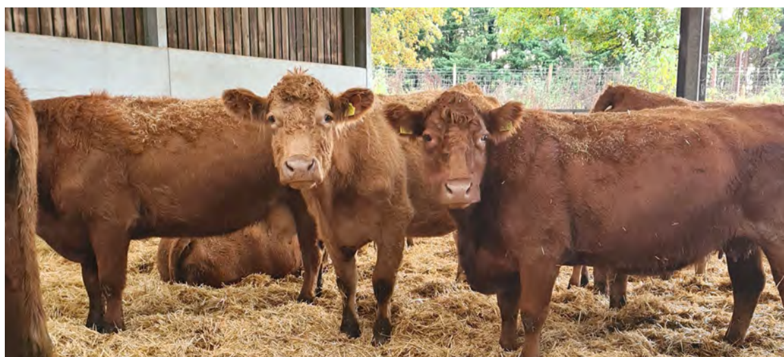
Stabiliser beef kúr í inniádstöðunni.