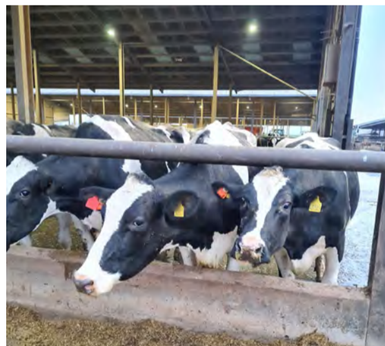
Kúr á Gleadthorpe búinu.