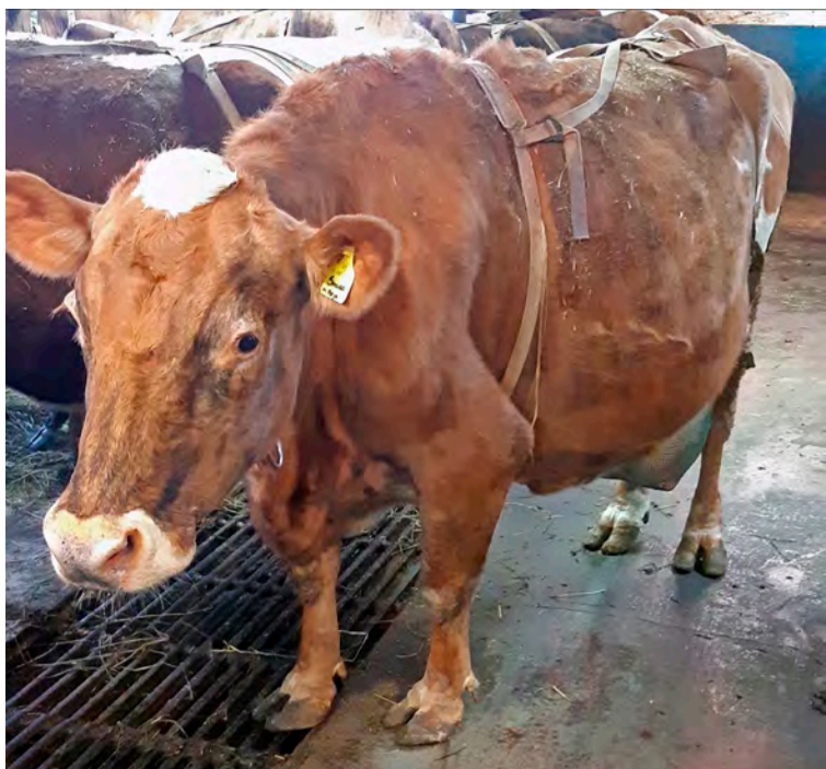
Smuga 465 í Ytri-Hofdölum var nythæst allra kúa á landinu á árinu 2020 með 14.565 kg í ársafurðir. Sem er mesta nyt sem skráð hefur verið á einu almanaksári.